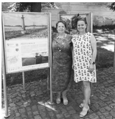
Má vlast cestami proměn – výstavní panely Příběhy domova