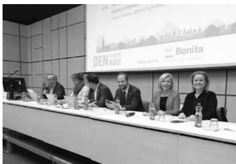
Tradičně se účastníme Dnu malých obcí

Na akci vystoupili také představitelé organizací zastupujících venkovské samosprávy.