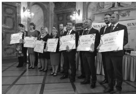
Vítězné obce v soutěži o Oranžovou stuhu

Oranžovou stuhu ČR roku 2022 získala obec Mažice z Jihočeského kraje. Na druhém místě, v celostátním kole oranžové stuhu, se umístila obec Sudoměřice z Jihomoravského kraje a třetí místo obsadila obec Stračov z Královéhradeckého kraje.