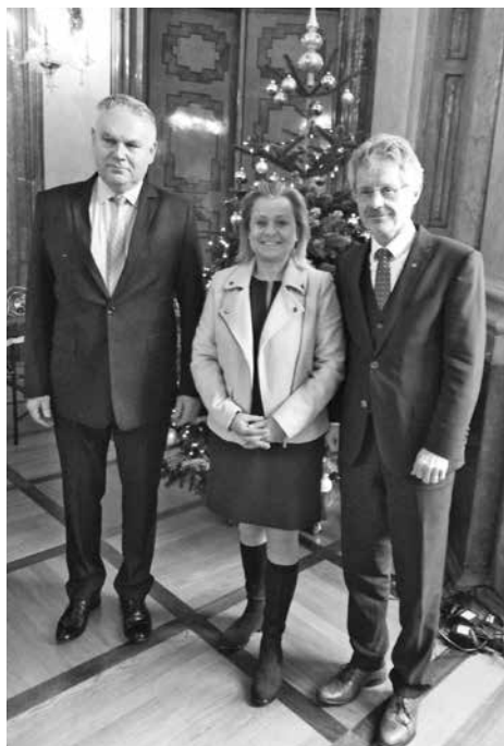
Blahopřání z úst předsedy Senátu PČR umocnilo slavnostní atmosféru setkání