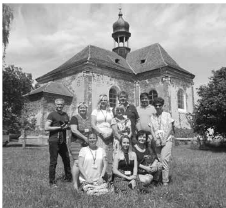
Hodnotitelská komise VR