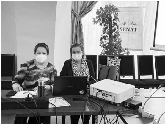
Počátek roku, a ještě covidová opatření