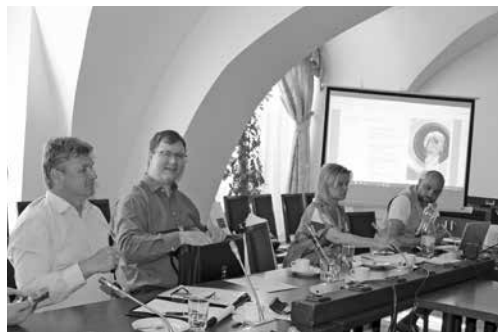
Odpadové hospodářství a plasty

Odpadové hospodářství, třídění plastů: EKO-KOM, a. s., Česká asociace odpadového hospodářství, Mattoni, Iniciativa pro zálohování Příprava jednodenní Konference k problematice venkova 2022