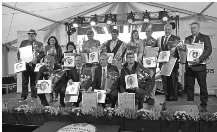
Radost všech zástupců zúčastněných obcí