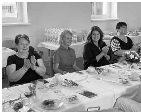
Delegace Středočeského kraje