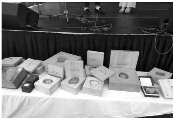
Tentokrát ve venkovních prostorách Strahovského kláštera se sešla všechna srdce z krajů

Povedené stavební rekonstrukce nebo úpravy krajiny a tvůrci takových proměn. Každoročně se obce pochlubí se svým dílem na výstavě a inspirují ostatní. 30.6. se jednotlivé kolekce rozjedou na své tradiční poutě po celé naší zemi a na Slovensko. Budete je opět potkávat na náměstích, návších, nádražích, v knihovnách. V průběhu roku budou zajímavosti o vystavených proměnách publikovány v médiích, na webových stránkách partnerů i na Facebooku a webu výstavy www.cestamipromen.cz , kde je možné opět hlasovat pro nekrásnější proměnu.