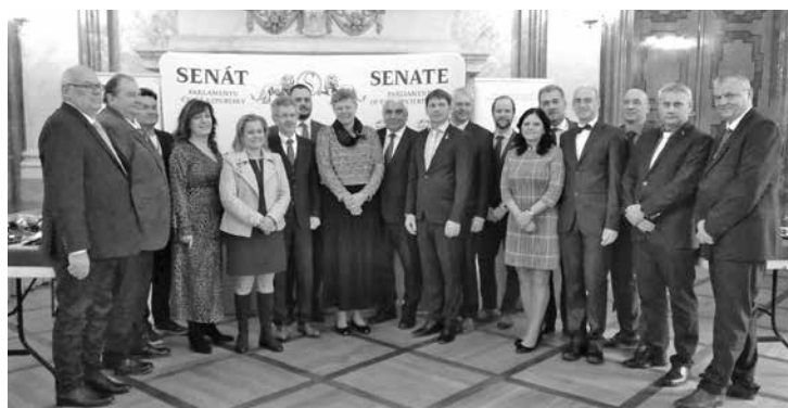
Zástupci vítězných obcí se v předvánočním čase sešli v Hlavním sále Valdštejnského paláce