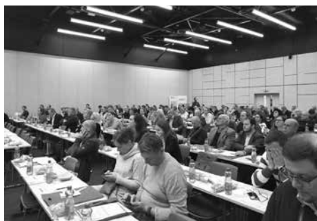
Účastníci 56. Dnu malých obcí v Praze