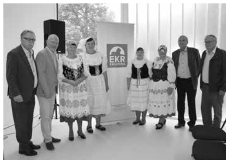
Účastníky semináře i přednášející uvítaly „Tetičky z Pištiny“ chlebem a solí