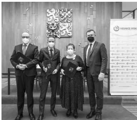
Vyhlášení soutěže Vesnice roku v PS PČR a podpis podmínek 26. ročníku

Neprobíhala soutěž Vesnice roku, ale v několika krajích se uskutečnily přehlídky práce, aktivit a činnosti v obcích. Najednou se soutěž nebrala jako každoroční samozřejmost a bylo vidět, že obcím toto pěkné poměrování sil chybí, a tak jsme se s chutí pustili do přípravy 26. ročníku soutěže.