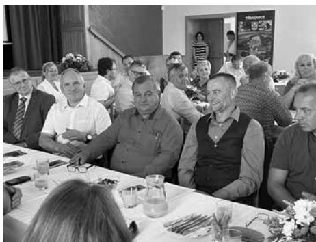
Příjemné prostředí a dobrá nálada všech zúčastněných