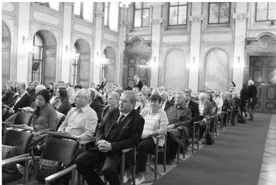
Z řad zastupitelů obcí i další zemědělské veřejnosti byl o účast na konferenci velký zájem, zaplnili celý Hlavní sál Valdštejnského paláce, sídla Senátu PČR

nou je nyní poněkud upozaděna krize jiná. Krize, která je ovšem ve svých dopadech neméně závažná a jejíž řešení není o nic méně naléhavé. Jde o globální změny klimatu. Tyto globální změny mají zcela lokální neblahé dopady. Ty se pak na venkově projevují konkrétně ztrátou biologické rozmanitosti, degradací půdy, nedostatkem vody a celkovým snižováním kvality života drtivé většiny tamních obyvatel. To souvisí i s procesem postupného vylidňování venkova. Chceme-li, aby si naše země do budoucna uchovala svůj tradiční ráz a rozvíjela to, co nám zde po sobě zanechali naši předci, je třeba bedlivěji naslouchat hlasům zejména lidí takřkajíc přímo z terénu.“