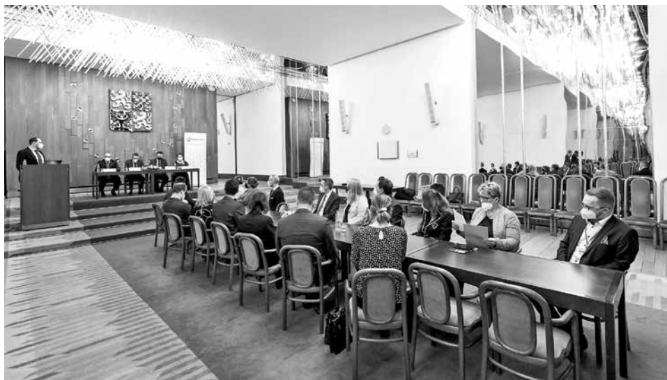
Podpisu podmínek vyhlášovateli soutěže byli přítomni i zástupci spoluvyhlašovatelů

A tak po dvouleté přestávce, byl 24. února slavnostně vyhlášen nový ročník soutěže Vesnice roku.