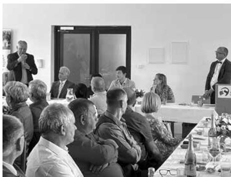
Ze slavnostního shromáždění k 20. výročí SPOV MsK v Třanovicích

Slavnostní shromáždění členů Spolku pro obnovu venkova Moravskoslezského kraje k jeho 20. výročí založení se uskutečnilo dne 16. června 2022 ve společenském sále obce Třanovice. Akce se účastnilo přes 60 osob, především starostů obcí z celého kraje. Záštitu nad akcí převzala europoslankyně a předsedkyně SPOV České republiky Ing. Veronika Vrecionová, účastnili se zde i zástupci MMR ČR a Moravskoslezského kraje, předsedové krajských spolků SPOV z Olomouckého a Středočeského kraje i z Kraje Vysočina.