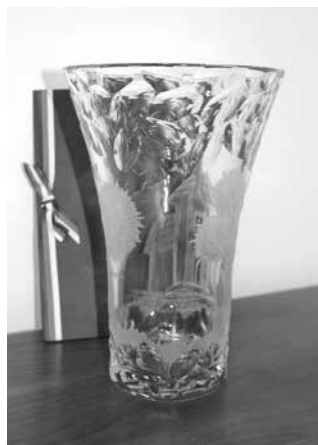
Broušená váza pro Osobnost venkova Radko Martíňka