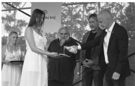
Ocenění vítězné obci v krajském kole SVR předal hejtman Martin Kuba