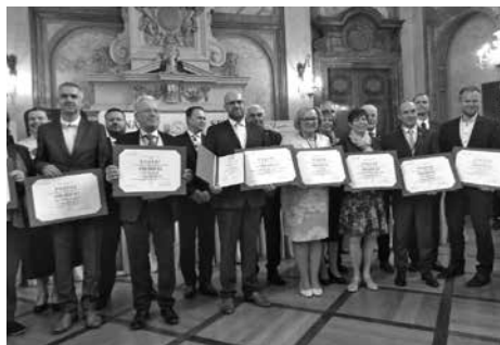
Vítězné obce v soutěži o Zelenou stuhu