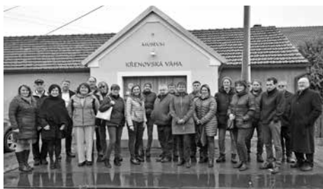
Účastníci semináře v obci Křenovy