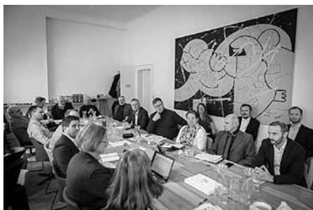
Ustavující zasedání Unie komunitní energetiky