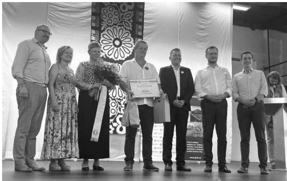
Slavnostní vyhlášení vítězů v krajském kole SVR

Zpracoval: Otakar Březina předseda SPOV Jihomoravského kraje