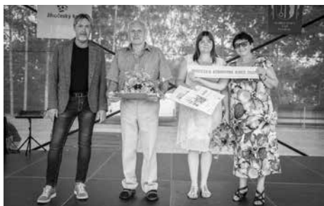
Ocenění Knihovna roku