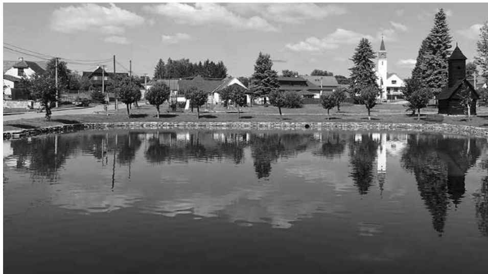
Obec Třeštice, krajský vítěz, 2. místo v celostátním hodnocení a vítěz Ceny veřejnosti