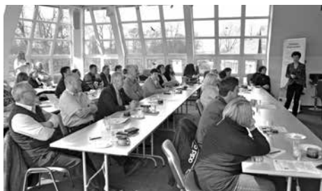
Motivační seminář k Vesnici roku