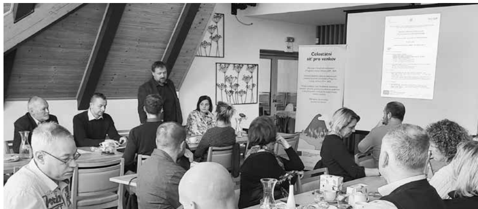
Setkání zástupců samospráv_členů SPOV OK a SPOV ZK v Lidečku ve dnech 14.-15. 11.2022

náře a Zlatá, Oranžová a Zelená stuha, kterými byly některé z nich oceněny. I v tomto roce CSV realizovala webináře k jednotné žádosti, které měly osvětlit zájemcům z našeho regionu problematiku dotační podpory a prezentovat příklady dobré praxe. Tyto webináře byly ze strany účastníků velmi pozitivně hodnoceny a již tradičně se vyznačují velkým zájmem a účastí. Neméně velký zájem vzbudil také workshop zaměřený na PRV 2014–2020 a LEADER, který Síť ve spolupráci s partnery v loňském roce realizovala.