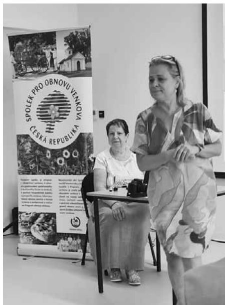
Zahájení semináře v novém pavilonu Z