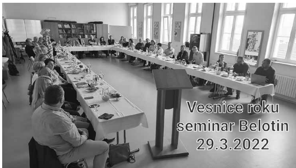
Účastníci Motivačního semináře SVR v Olomouckém kraji, v Bělotině

Nejmenší obcí z krajských vítězů byla obec Suchá Lhota z Pardubického kraje, která má 86 obyvatel. Největší obcí byla obec Stráž pod Ralskem z Libereckého kraje, kde žije 4057 obyvatel.