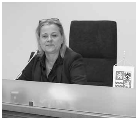
Zahájení valné hromady SPOV

Valná hromada schválila: program, zapisovatele a ověřovatele zápisu, mandátovou a návrhovou komisi, Zprávu o činnosti za rok 2021, Zprávu Revizní komise, Účetní závěrku a přílohu k účetní závěrce za rok 2021, Rozpočet na rok 2022 a Podíl na příspěvcích členů SPOV pro krajské organizace ve výši 30% .