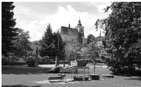
Slatinice – Zlatá stuha – vyhlášení výsledků Vesnice Olomouckého kraje roku 2022

CSV se ve spolupráci se SPOV Olomouckého kraje již tradičně aktivně podílela na organizaci motivačního semináře k soutěži Vesnice roku se zvláštním zaměřením na ocenění Oranžová stuha. Cílem semináře bylo zejména motivovat zájemce a prezentovat přínosy soutěže od samotných účastníků, ale i z pohledu hodnotitelské komise. Jako velmi pozitivní výsledek této motivace bylo 10 přihlášených obcí z řad účastníků semi-