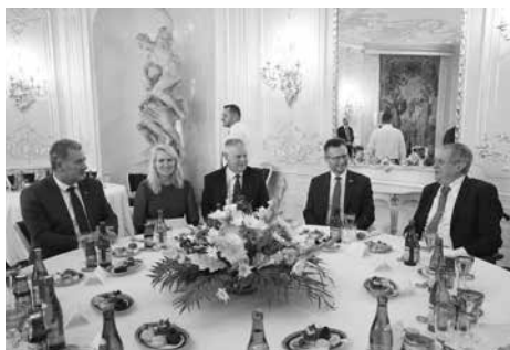
V odpolední části slavnostního dne probíhalo přijetí prezidentem republiky na Pražském hradě