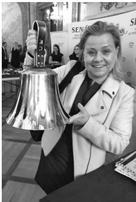
Zvonky dobré zprávy