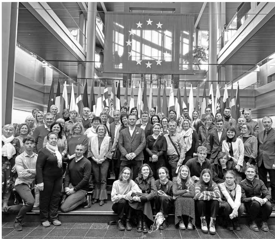
Skupina účastníků zájezdu do Evropského parlamentu ve Štrasburku