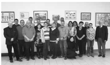
Účastníci semináře v obci Břasy