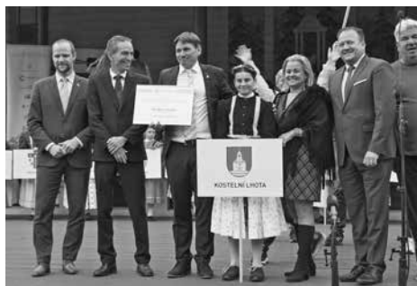
Vítěz 26. ročníku SVR a nositel titulu Vesnice roku 2022 Kostelní Lhota