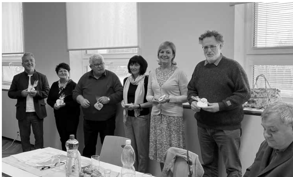
Poděkování členům krajské hodnotitelské komise SVR 2022

Volební valná hromada SPOV Moravskoslezského kraje, která se uskutečňuje jednou za 4 roky, se bude konat 16. února 2023 v konferenčním sále Muzea potravin a zemědělských strojů v Dolní oblasti Vítkovic.