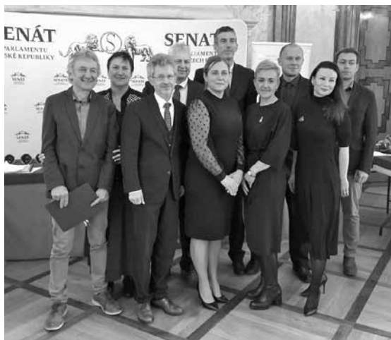
Závěrečná oslava 2. místa obce Třeštice v celostátním hodnocení SVR v Senátu PČR s předsedou Senátu Milošem Vystrčillem

Krajská organizace zorganizovala během roku dva dvoudenní semináře ve spolupráci se SZIF Brno nazvané „Venkov nás inspiruje – příklady spolupráce a dobré praxe“. První ve dnech 17. – 28.4. proběhl na Zámku ve Žďáru nad Sázavou, v družstvu Hodice a v obci Třeštice. Druhý seminář ve dnech 23. – 24.11.2022 proběhl v obci Rudka, Morkůvky, Popice a Strachotín.