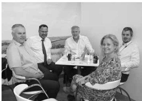
Místo ve stánku je navštěvováno řadou hostů, poslanců i senátorů