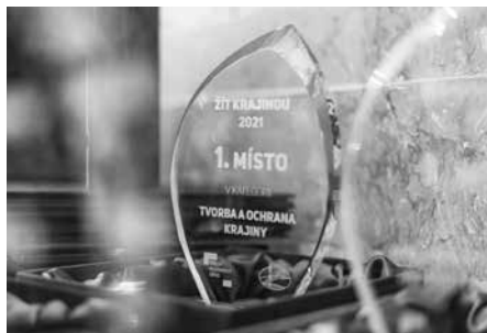
Ocenění pozemkových úprav

V úterý 8. listopadu 2022 se v prostorách Senátu Parlamentu ČR uskutečnilo vyhlášení výsledků 15. ročníku soutěže Žít krajinou, kterou pořádá Státní pozemkový úřad ve spolupráci se Stálou komisí senátu pro rozvoj venkova a s Českomoravskou komorou pro pozemkové úpravy. Jejím cílem je ocenit nejuspěšnější realizace pozemkových úprav, které jsou komplexním a účinným nástrojem, jak vrátit krajině její schopnost vyrovnávat se s klimatickými změnami i vlivy zemědělské činnosti. Mají pozitivní přínos pro kvalitu životního prostředí a zvyšují i celkovou kvalitu života na venkově. Záštitu nad akcí převzal ministr zemědělství Ing. Zdeněk Nekula.